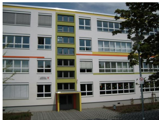
Bsp.: Sekundarschule Heinrich Heine in Halle / Saale