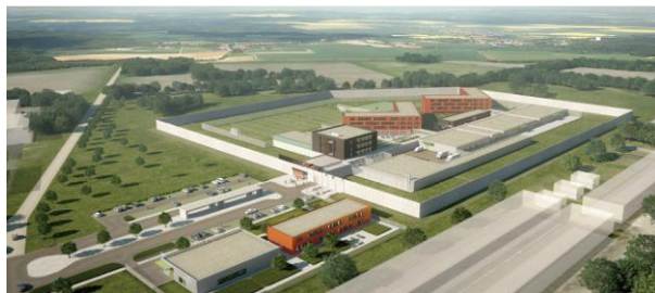
Animation: Plan2, München