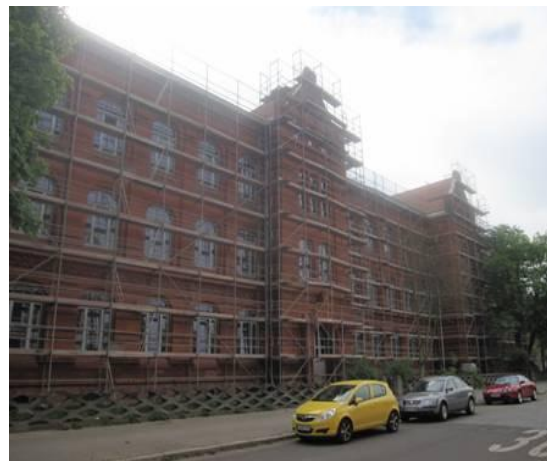
Bsp.: Werner v. Siemens Gymnasium Magdeburg

Quelle: Landesrechnungshof Sachsen-Anhalt