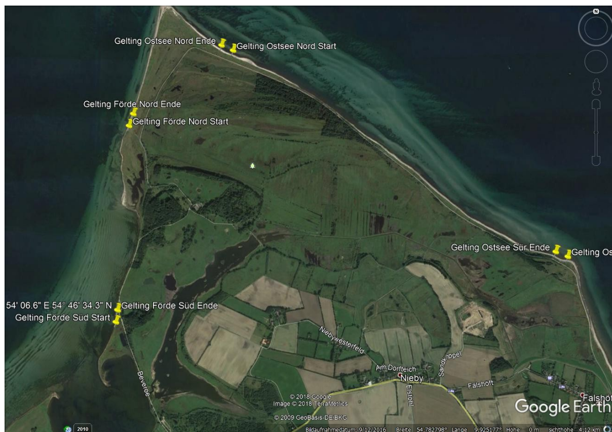
Abbildung 2: Abfallsammelstrecken entlang der Geltinger Birk

Um die Belastung der Küsten zu erfassen, wird seit 2018 am südlichen Ende der Flensburger Förde im Naturschutzgebiet Geltinger Birk ein Strandmüllmonitoring durchgeführt. An vier Abschnitten von je 100 m Länge und der gesamten Strandbreite werden viermal im Jahr sämtliche Abfälle ab 2,5 cm Länge eingesammelt (Abbildung 2). Im Anschluss werden sie soweit möglich nach Material und Herkunft in eine Liste mit 118 unterschiedlichen Kategorien eingruppiert und am Folgetag trocken und möglichst sandfrei gewogen. Von den vier Abschnitten der Geltinger Birk liegen je zwei innerhalb und zwei außerhalb der Flensburger Förde. Alle Abschnitte liegen in von der HELCOM als „rural“ (entlegen, ländlich) definierten Bereichen. Sie sind darüber hinaus als Schutzgebiete für die Öffentlichkeit nicht zugänglich. Es werden daher ausschließlich vom Meer oder Wind eingetragene Abfälle erfasst und keine direkten Hinterlassenschaften durch Touristinnen und Touristen oder Ausflüglerinnen und Ausflügler. Nach u.a. corona- und personalbedingt lückenhafter Datenerhebung in den letzten Jahren wird das Monitoring inzwischen wieder turnusgemäß durchgeführt, aktuelle Daten liegen allerdings noch nicht vor.