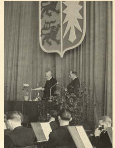
Ministerpräsident Lüdemann spricht zu den Abgeordneten

Als weitere wichtige Aufgabe mahnte Lüdemann die „Vollendung des demokratischen Aufbaus“ an. Hierzu gehöre auf kommunaler Ebene „die Möglichkeit der Kontrolle durch das Volk in Ausschüssen und öffentlichen Sitzungen“ sowie die Verabschiedung einer Landesverfassung durch den Landtag.