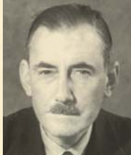
Zivilgouverneur Hugh de Crespigny

Wohnraumbeschaffung, die Verteilung von Nahrungsmitteln und Brennstoffen und die Gesundheitsvorsorge. Bei der Entnazifizierung forderte Crespigny Milde für die Jugend, denn „es wäre falsch, denen den Rückweg zu versperren, die in frühesten Jahren nach den Grundsät-