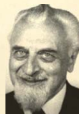
Ministerpräsident Hermann Lüdemann (SPD)

Zur Milderung des Hungerproblems gab Lüdemann das Ziel vor, innerhalb von drei Jahren „eine Erhöhung der landwirtschaftlichen Produktion um 50 Prozent“ zu erreichen. „Dazu“, so der Sozialdemokrat