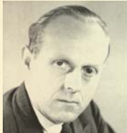
Minister Erich Arp (SPD)

Deutschen die Möglichkeit zur Selbsthilfe genommen. Zudem seien „teilweise in feierlichster Form“ abgegebene Zusagen der Alliierten auf Einfuhren nicht eingehalten worden. Nach Arps Angaben können eine halbe Million Menschen, die in Schleswig-Holsteins großen Städten leben, nur auf 735 Kalorien pro Tag zurückgreifen. Die Hungerkatastrophe sei im Lande „schlimmer als in irgend einer anderen deutschen Landschaft, weil unsere 1,2 Millionen einge-