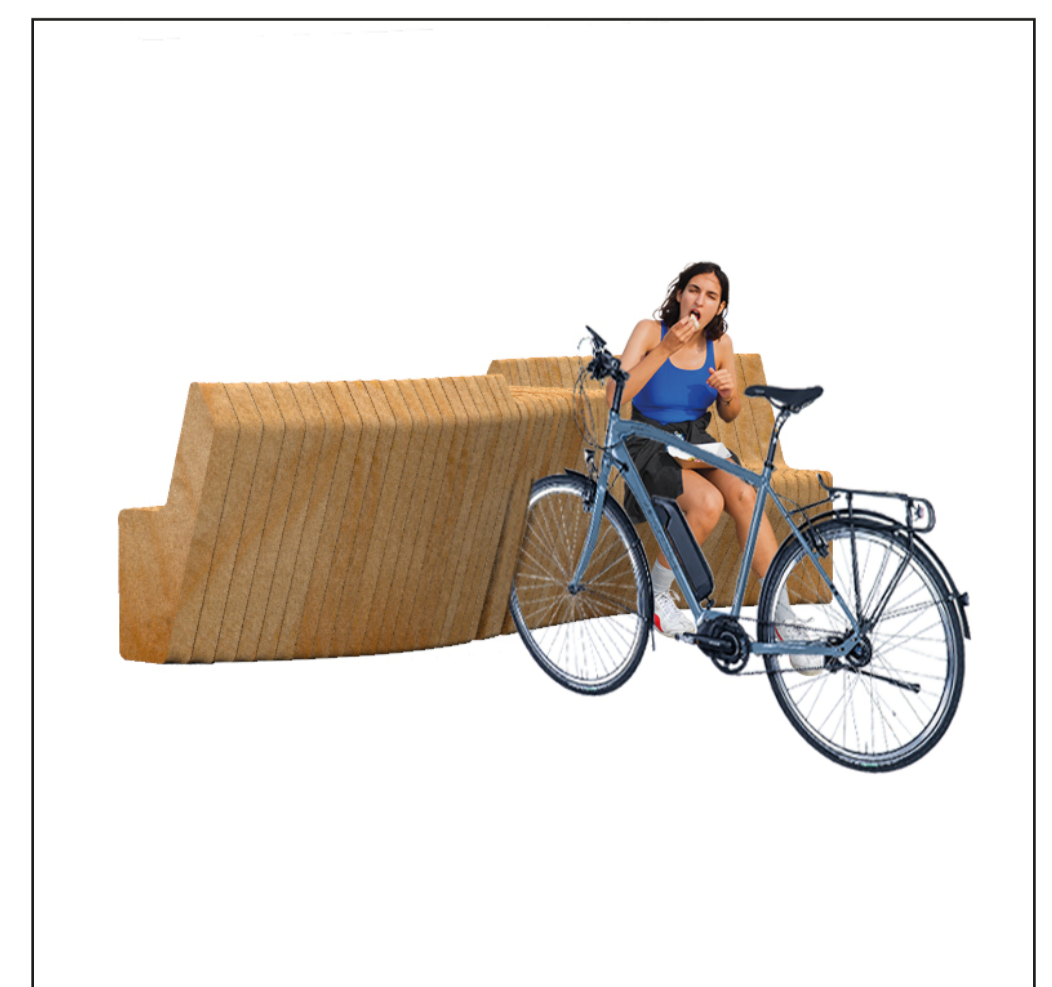
Alternative: Abstellmöglichkeit für Fahrräder