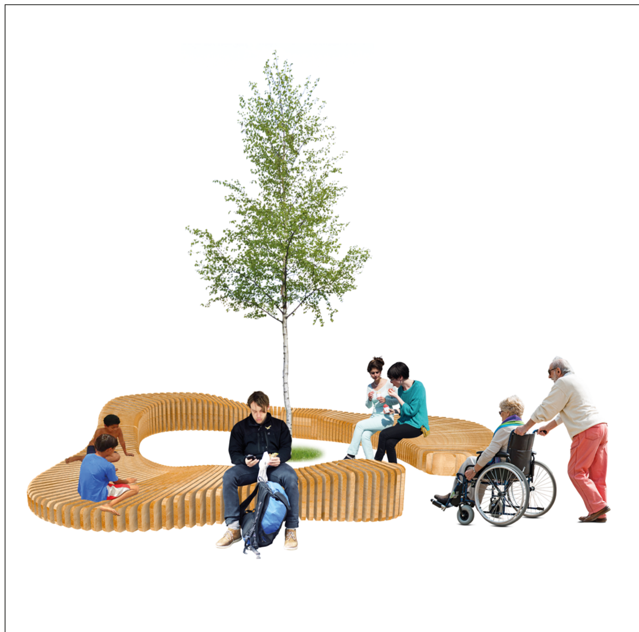
Treffen, Verweilen und Spielen