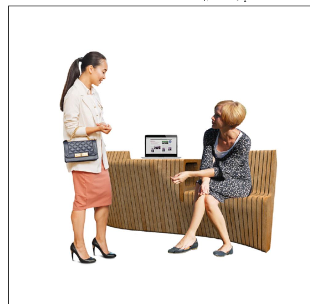
Arbeiten und Kommunizieren