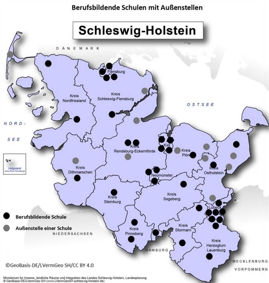
Abbildung 2: Berufsbildende Schulen mit Außenstellen in Schleswig-Holstein

Schleswig-Holstein hat ein funktionierendes System aus 35 Berufsbildenden Schulen, an denen 250 Berufe beschult werden. Dieses System machen wir fit für die Zukunft, indem wir die Standorte der Berufsbildenden Schulen und der Regionalen Berufsbildungszentren in der Fläche erhalten und die Qualität des Unterrichts durch eine Profilbildung der Schulen stärken. Dabei werden wir auch die Möglichkeiten der Digitalisierung nutzen und z.B. hybride Lernformen weiterentwickeln.