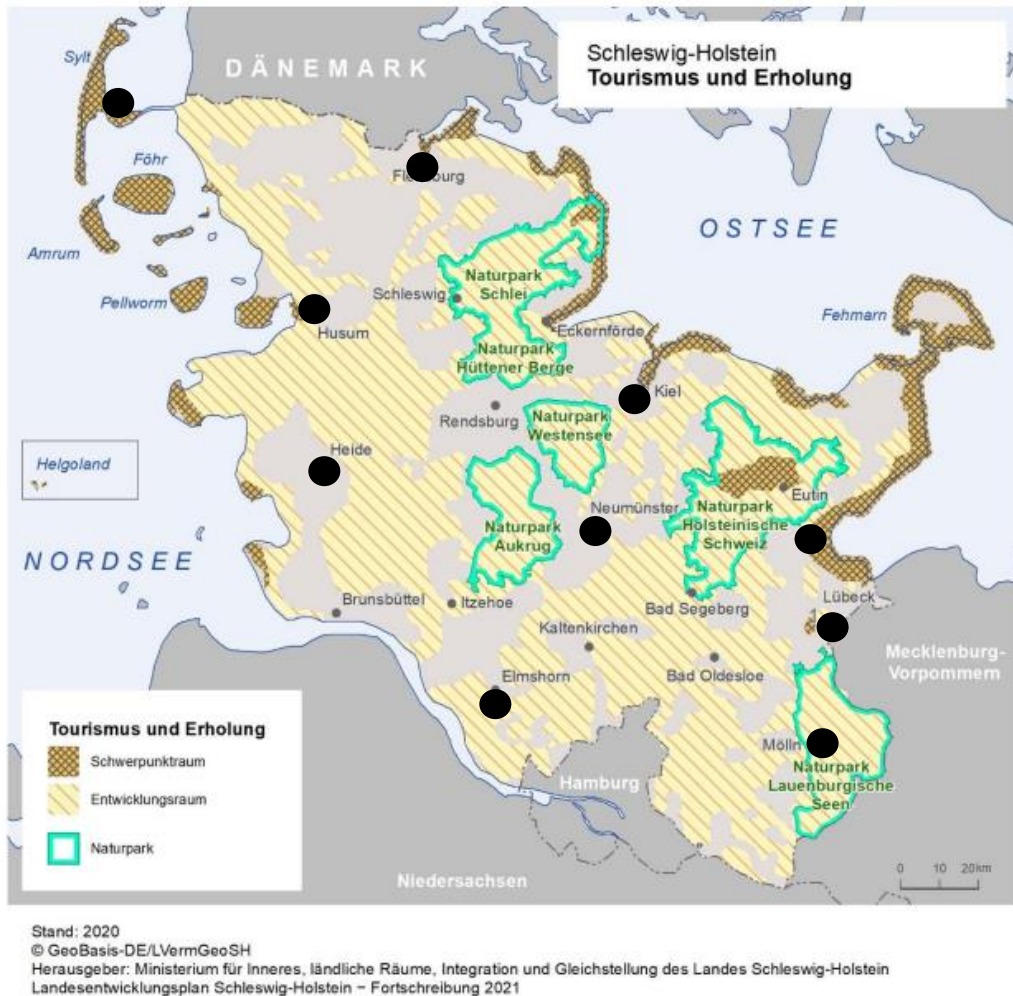
Abbildung 5: Schwerpunkträume des Tourismus in Schleswig-Holstein und Berufschulstandorte der Gastronomie