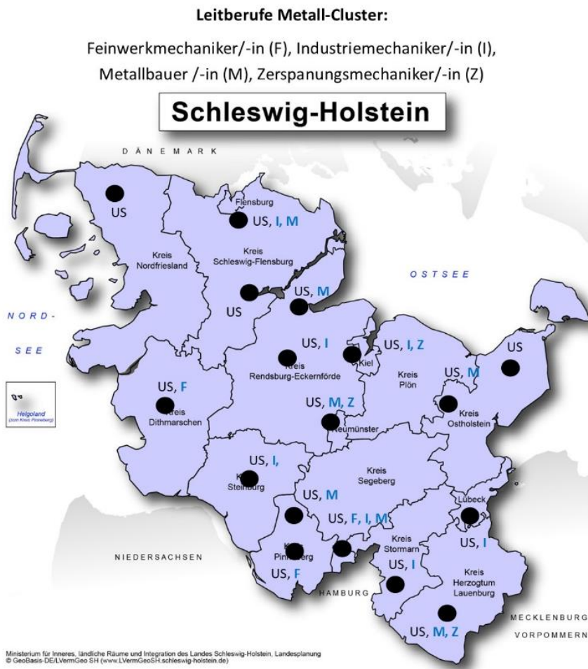
Abbildung 4: Vorschlag zum Metall-Cluster: Beschulung der Metall-Unterstufe und der vier Leitberufe ab dem zweiten Ausbildungsjahr

Technischer Produktdesigner / Technische Produktdesignerin Fachrichtung Maschinen- und Anlagenkonstruktion und Fachrichtung Produktgestaltung und -konstruktion: