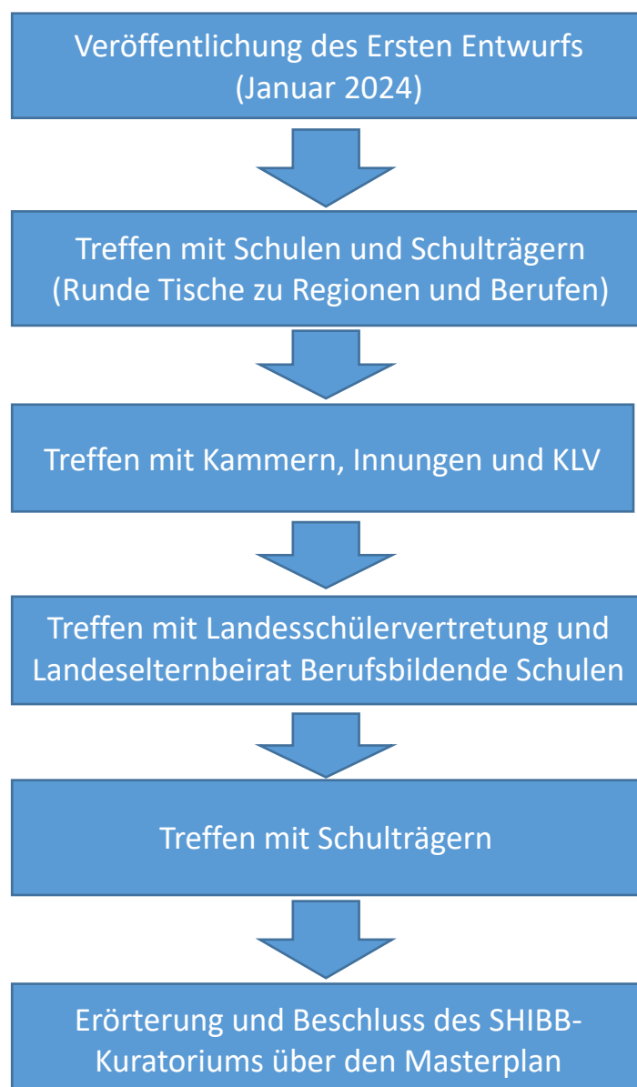
Abbildung 6: Ausarbeitung des Masterplans (bis 01.08 2024)

Insgesamt wären mit diesem Vorschlag nur gut 20 % der Berufe und maximal 10 % der Auszubildenden von weitergehenden Änderungen betroffen. Mit dem Masterplan wird das Verhältnis von Qualität der Beschulung, die häufig mit Profilbildung und Konzentration verbunden ist, zu den regionalen Bedürfnissen, die v.a. Ortsnähe für die Auszubildenden und die Betriebe bedeuten, austariert.